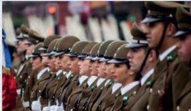
▲ Carabineros de Chile durante una ceremonia oficial.

El Estado puede a veces parecer un concepto teórico o un ente muy lejano, pero lo cierto es que está más cerca de lo que crees y actúa constantemente al interior de nuestras comunidades, como reflejan las dos fotografías que te presentamos a continuación.