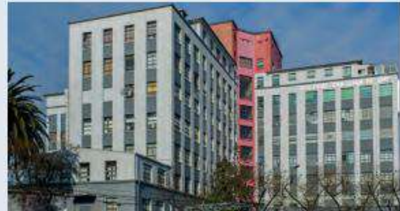
▲ Hospital San Juan de Dios, parte del Sistema Nacional de Servicios de Salud (SNSS).